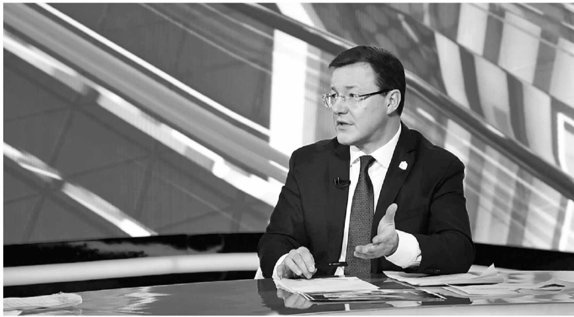
СЪЕМКОТ С ВИДЕО

ГУБЕРНАТОР РАССКАЗАЛ В ПРЯМОМ ЭФИРЕ О БОРЬБЕ С КОРОНАВИРУСОМ И МЕРАХ ПОДДЕРЖКИ ЖИТЕЛЕЙ